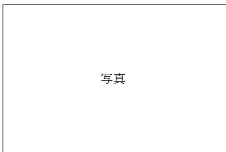
(メインメニュー出力画面)

フィールド上の戦闘プレイモードでメニュー表示キー操作を行なうことにより、メニューモードになります。メニューから戦闘プレイモードに戻る時はキャンセルキーを用います。